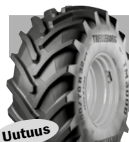
TM PUIMUREIHIN JA MUIHIN RASKAISIIN KÄYTTÖTARKOITUKSIIN