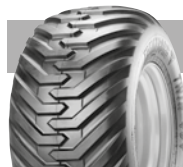
TWIN GARDEN TRACTOR