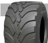
TWIN RADIAL VAUNUIHIN