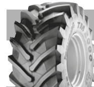
TM PUIMUREIHIN JA MUIHIN RASKAISIIN KÄYTTÖTARKOITUKSIIN